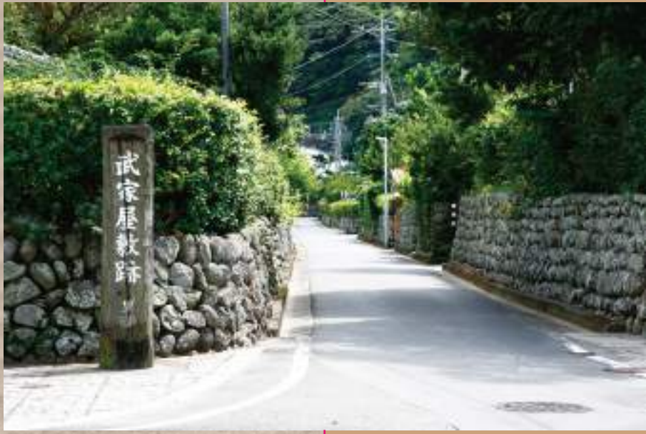
里町武家屋敷跡通り (上甕島)