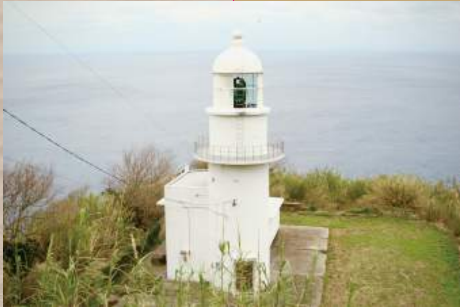
釣掛崎灯台(下甑島)