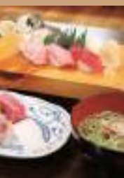
寿し膳かこ(上甑島)